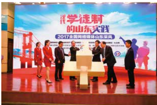
人才培养模式获行业认可，2017全国网络媒体山东采风在我院启动