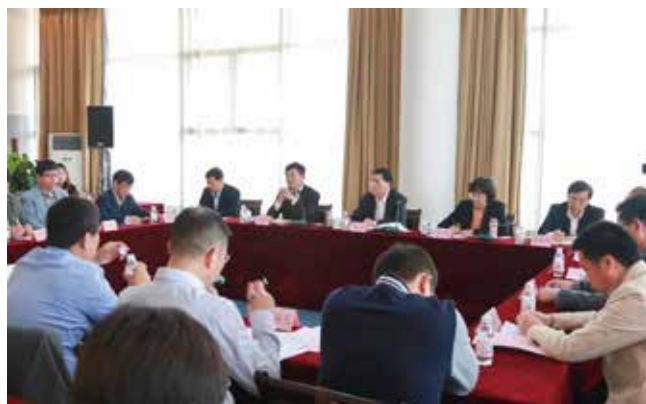
原山东省副省长夏耕来学院参加中小进出口校友企业座谈，共商对外贸易发展